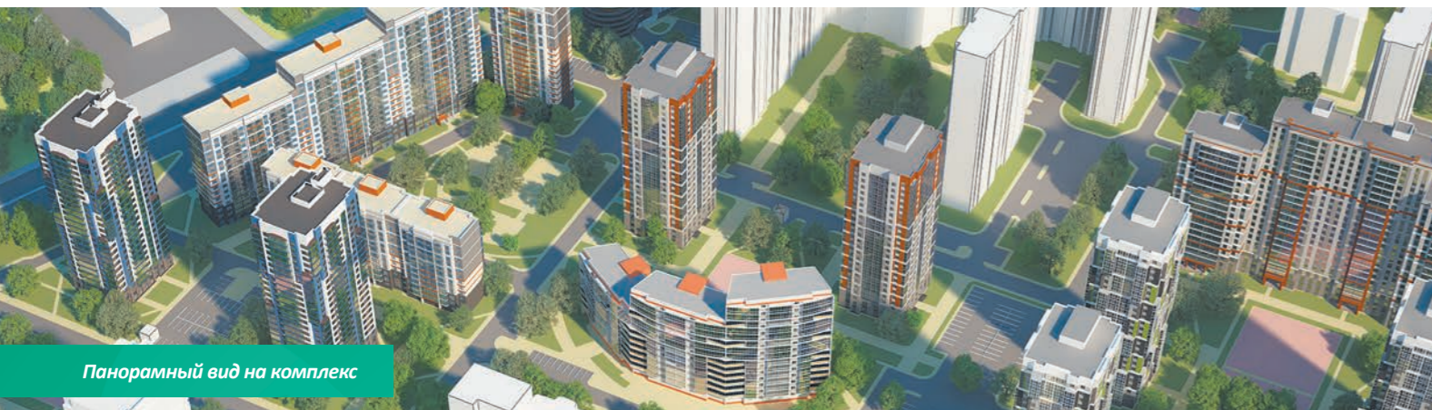
Панорамный вид на комплекс

Комплекс расположен в окружении развитой торговой и социальной инфраструктуры. Рядом крупные сетевые гипермаркеты: Карусель, Максидом и Метрика, мебельные центры: Мебель Сити и Аквилон, торгово-развлекательные центры, современный кинотеатр, боулинг центр. В шаговой доступности несколько школ и детских садов, поликлиники, аптеки, отделения банков.